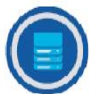
Клиентские базы данных

На рисунке представлены шесть основных целей для хакеров, взламывающих корпоративные системы, и меры, которые можно принять для защиты от них. В современном цифровом мире, где данные играют все более важную роль, киберпреступность может принимать различные формы. Киберпреступники часто охотятся на информацию, а с ростом числа подключенных к сети устройств на рабочих местах (от смартфонов и планшетов до WiFi-принтеров) количество точек доступа, доступных хакерам, также увеличивается.