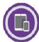
Смартфоны и планшеты сотрудников