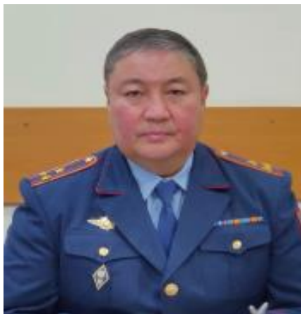
ТОЛОКУЛОВ Рахим Асанкулович старший оперуполномоченный по особо важным делам управления по противодействию экстремизма Департамента полиции Алматинской области полковник полиции